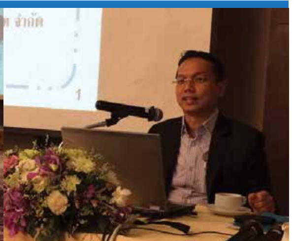
✍️ วิทยากรบรรยายให้กับผู้ลงทุน