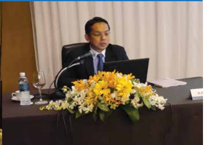
✍️ วิทยากรบรรยายให้กับสโมสรนักลงทุน