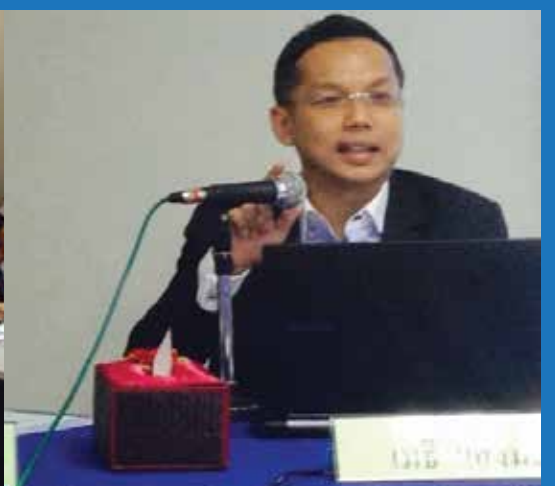
✍️ วิทยาการบรรยายให้กับผู้บริหารและเจ้าหน้าที่กรมสรรพากร ภาค 4